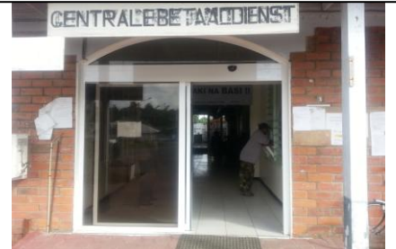
Foto's onder: De ruimte waar de One-Stop-Service balie voor het publiek komt. Hier zal de intake via de computer plaatsvinden. Deze dienst is gelinkt aan Burger Informatie Center (BIC), aangesloten op het DLGP Wide Area Net Work. Geen looperij voor de burger. BIC zoekt via het netwerk (Intern en extern) alles uit en bericht de burger over de afdoening dan wel over de verder te volgen stappen. In de hal komt een TV screen met doorlopende informatie over districtsactiviteiten.